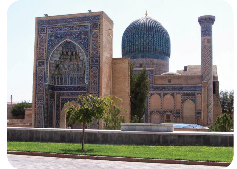
Semerkant'ta Bulunan Tilla Kari Camii