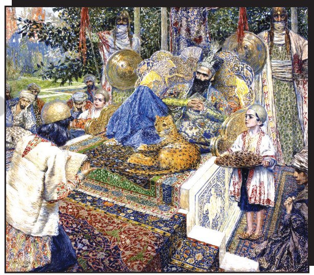
Gazneli Mahmud ve Firdevsi