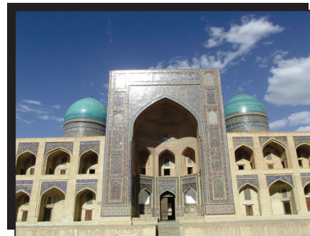
→ Buhara Medresesi