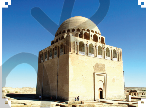
Sultan Sencer Türbesi