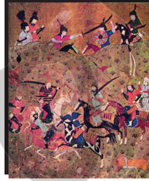
→ Dandanakan Savaşı Minyatürü