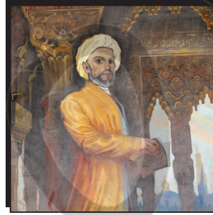
→ Yusuf Has Hacip'in Temsili Resmi