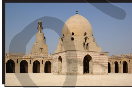
→ Tolunoğlu Ahmed Camii