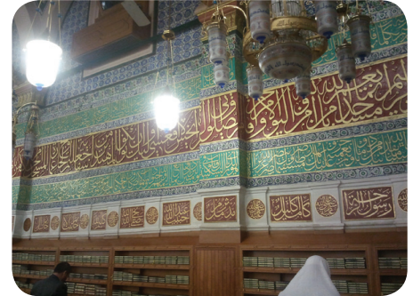
Mescid-i Nebevi'de Osmanlı Hat Sanatı