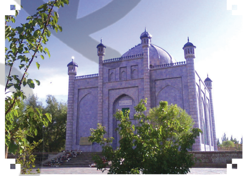
Satuk Buğra Han Türbesi