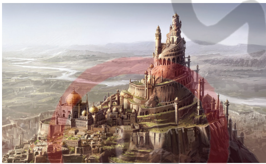
Alamut Kalesinin Temsili Resmi